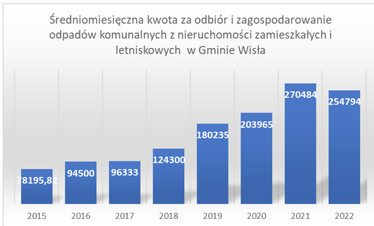
Wykres 1. Średnia miesięczna kwota za odbiór i zagospodarowanie odpadów komunalnych w Gminie Wiśła dla poszczególnych umów

Zgodnie z obowiązującymi przepisami prawa system gospodarowania odpadami komunalnymi w Gminie musi się bilansować.