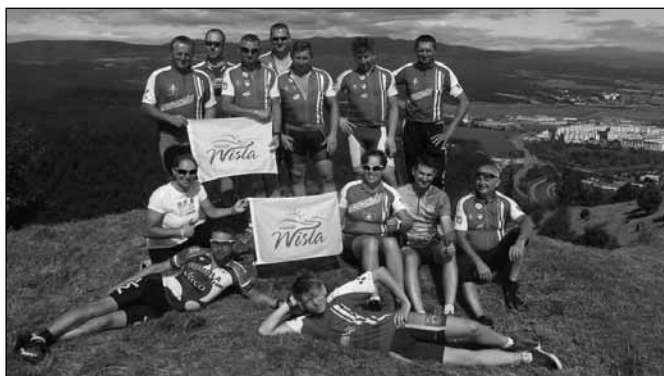
fol. Klub Cyklistów „Góral”