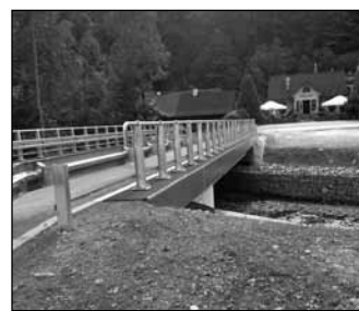
Most na Kopydle